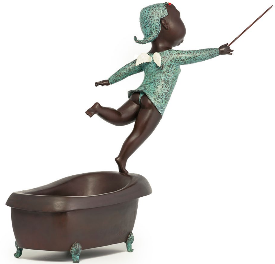
Uptown Girl - Angel's Fantasy