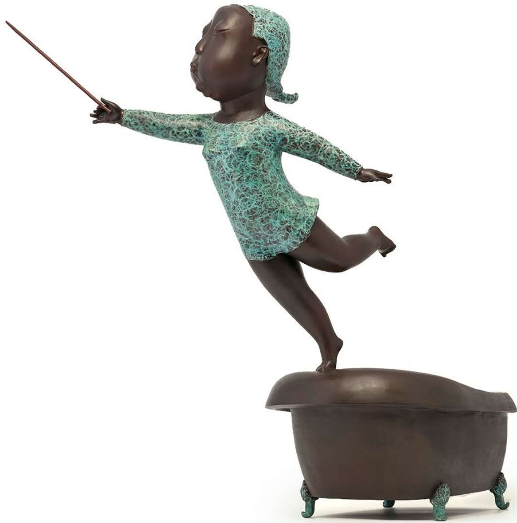
小女孩拿著指揮棒，單腳顛在浴盆上，像是個小天使，跟著音樂，揮動手裡的指揮棒，徜徉在音樂與快樂之中。